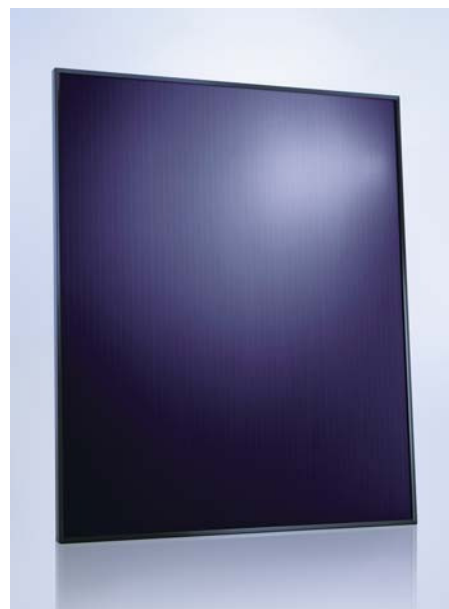
SCHOTT ASI™ 78/81/86/89