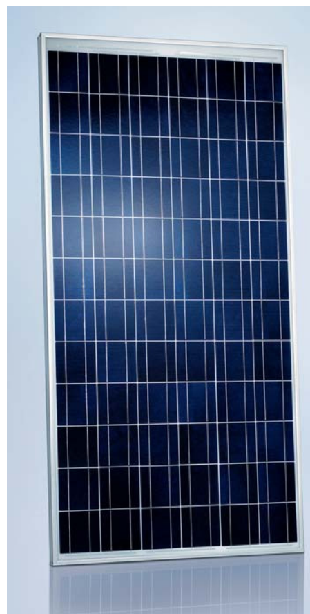
SCHOTT EFG™ 155/160/165/170